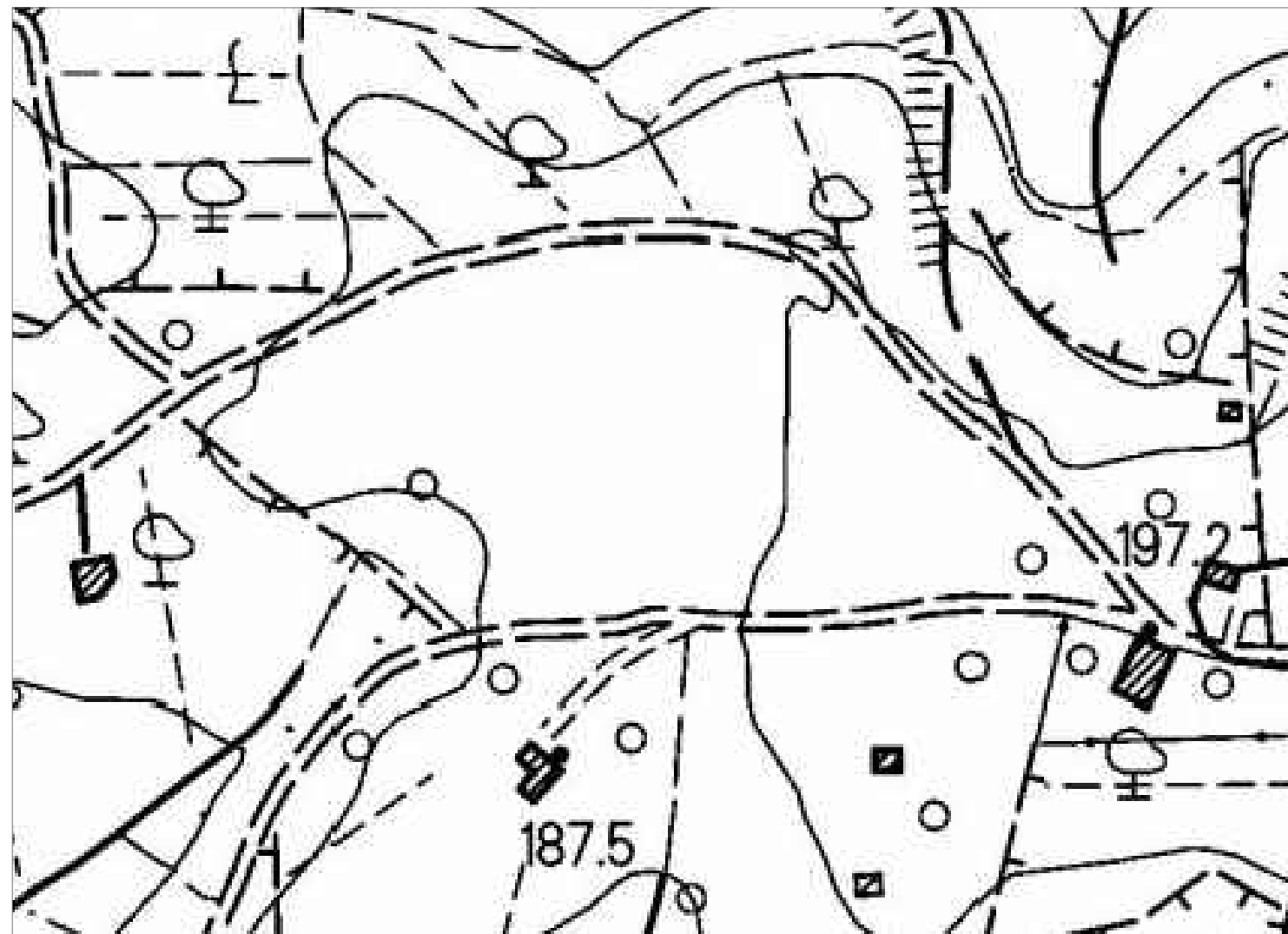
ESTRATTO CARTOGRAFIA REGIONALE TOSCANA scala 1:2000