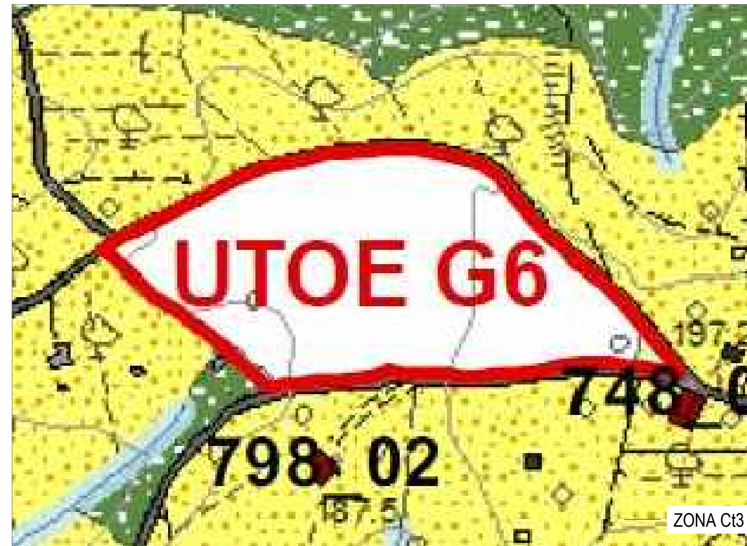
ESTRATTO REGOLAMENTO URBANISTICO - Carta Sottosistemi Funzionali UTOE Turistica Cerretelle G6 scala 1:2000